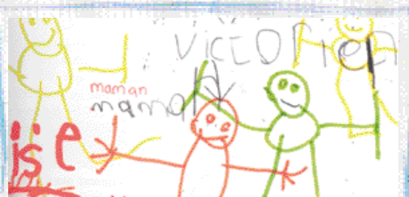
In Cahiers mémoires de vie - Leleu-Galland

La fonction du cahier de vie est bien de doter l'enfant d'un support de consignation et de conservation personnel gardant la trace, la mémoire de textes et de réalisations qui ont du sens pour lui en tant que personne. On peut se poser la question de savoir quels sont les écrits et signes qui sont réellement nécessaires à la vie d'un enfant, qu'il soit à l'école ou ailleurs. Pour les enfants jeunes, il y a assurément tous les dessins, les graphismes nés du mouvement de la main sur la surface recouverte. Du tracé aléatoire vont surgir, peu à peu des formes élaborées par tâtonnement. Dans ces graphismes la vie s'exprime, le dessin est un langage puissant, un moyen d'action sur le monde. Célestin Freinet voit dans les premiers dessins l'affirmation d'un pouvoir de l'enfant sur la surface, sur le milieu. On peut tracer avec son doigt dans le sable sur la vitre embuée... « À parti d'un certain degré de maîtrise, il ya dédoublement et bifurcation. L'enfant continue à