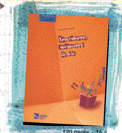
120 pages - 16 € CNDP. RESEAU