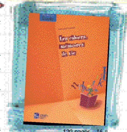
120 pages - 16 € CNDP. RESEAU