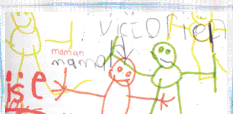
In Cahiers mémoires de vie - Leleu-Galland

La fonction du cahier de vie est bien de doter l'enfant d'un support de consignation et de conservation personnel gardant la trace, la mémoire de textes et de réalisations qui ont du sens pour lui en tant que personne. On peut se poser la question de savoir quels sont les écrits et signes qui sont réellement nécessaires à la vie d'un enfant, qu'il soit à l'école ou ailleurs. Pour les enfants jeunes, il y a assurément tous les dessins, les graphismes nés du mouvement de la main sur la surface recouverte. Du tracé aléatoire vont surgir, peu à peu des formes élaborées par tâtonnement. Dans ces graphismes la vie s'exprime, le dessin est un langage puissant, un moyen d'action sur le monde. Célestin Freinet voit dans les premiers dessins l'affirmation d'un pouvoir de l'enfant sur la surface, sur le milieu. On peut tracer avec son doigt dans le sable sur la vitre embuée... « À parti d'un certain degré de maîtrise, il ya dédoublement et bifurcation. L'enfant continue à