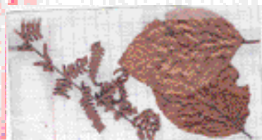
In Cahiers mémoires de vie - Leleu-Galland

Il crée un réseau de relations au sein du groupe, un partage d'expérience. Support de communication et d'apprentissage de la vie sociale. Repère d'appartenance et découverte des différences pour apprendre à vivre ensemble. »