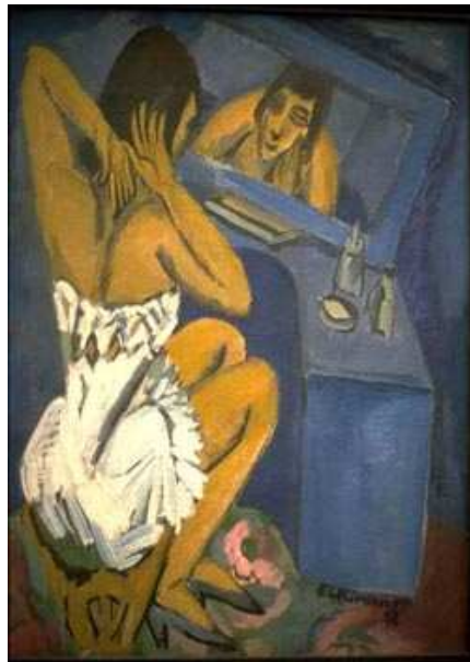
Ernst Ludwig Kirchner Woman at the Mirror 1912

Projet pédagogique 2008-2009 de la circonscription de Pontarlier