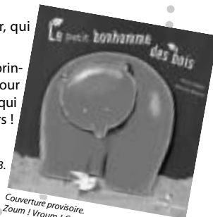
Couverture provisoire. Zoom ! Vroum ! Crash ! Les onomatopées ont la part belle dans le texte et dans la mise en page, pour le plaisir de la langue et des oreilles...