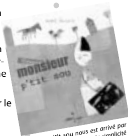
Monsieur p'tit sou nous est arrivé par la poste. Sa structure parfaite, la simplicité du ton et de la construction nous ont ravies à la première lecture.