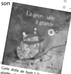
Cette drôle de forêt ? Des jambes de girafes élégantes. Cette grosse montagne ? Le dos d'un rhinocéros placide. Élodie Nouhen a trouvé dans ses images matière à poser des devinettes !

Un conte écrit par Francine Vidal, illustré par Élodie Nouhen Hors collection