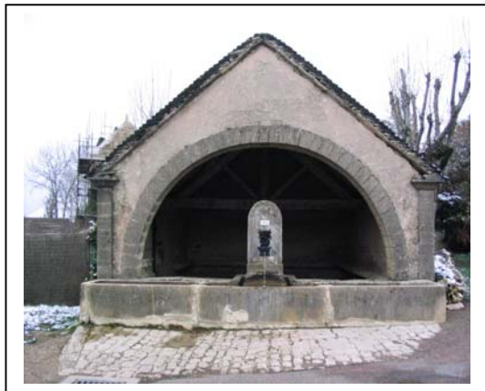
le lavoir de la Chaume

Ces documents concernent les deux lavoirs de Salmaise ( Côte d'Or ) , encore en place au cœur du village, ils donnent des indications sur le contexte de la construction, sur les étapes essentielles de la procédure administrative puis ils mentionnent les réfections significatives qui jalonnent la vie de toute construction. Ces textes constituent des matériaux pour une activité pédagogique, ils viennent mettre en perspective les données fonctionnelles et esthétiques recueillies sur place ou au moyen de documents de substitution ( vues intérieures et extérieures du bâtiment, plan...).