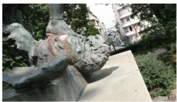
Détail Aigle royal foule au pied. (Vue de trois quarts)