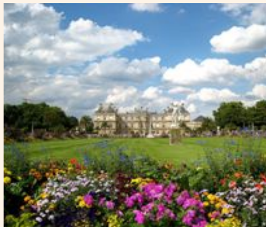
Titre : Jardin du Luxembourg and the Luxembourg Palace, Paris

http://www.crdp-toulouse.fr/IMG/pdf/concours_écriture_illustration.pdf